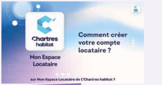
Je crée mon compte sur "Mon espace locataire"