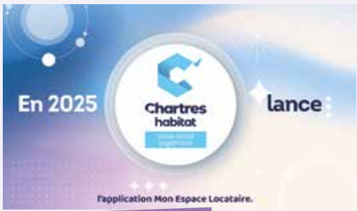
A la découverte de "Mon espace locataire"