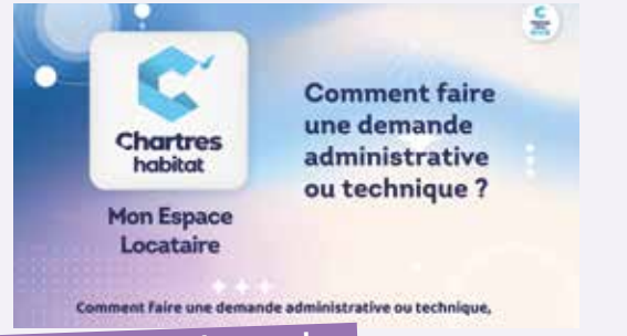
Je transmets une demande technique ou administrative